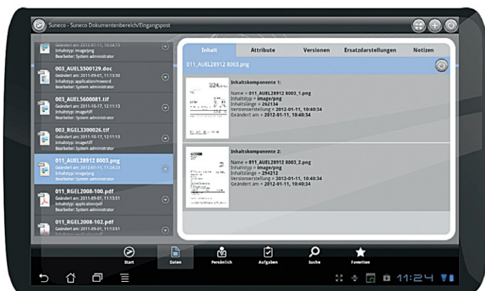
Auch unterwegs stets auf aktuelle Dokumente zugreifen